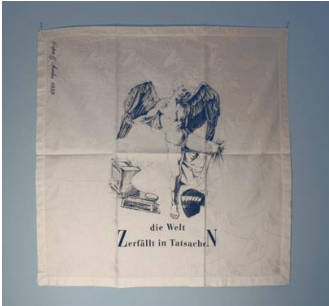
“die Welt zerfällt in Tatsachen”, Siebdruck auf Serviette mit 50er Jahre Muster, 1999