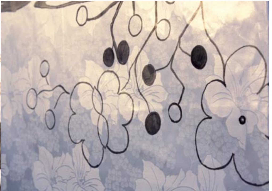
“Zeit”, Acryl auf Afrikadamast, 2010. ca. 140x200cm