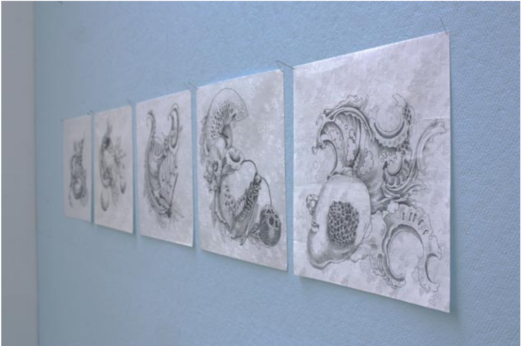
“roccailles“, Tusche auf historischem Damast, 2007, je 30x30cm