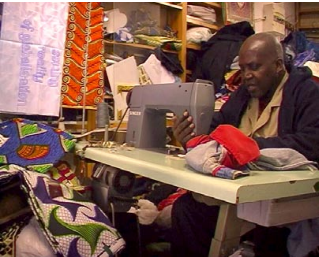
“sewing reality of globalisation”, links: Videostillleben, Marseille 2009