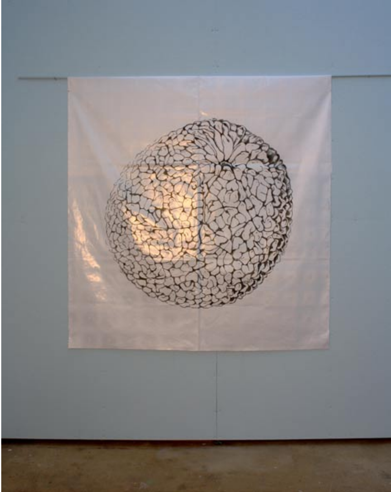
"bitter orange moon", 2010, ca. 140x140cm

Baumwolldamast mit glänzender Oberfläche für Afrika made in Germany