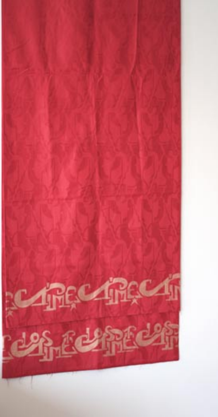
“Time - Lost Time”, Acryl auf Afrikadamast, 2010