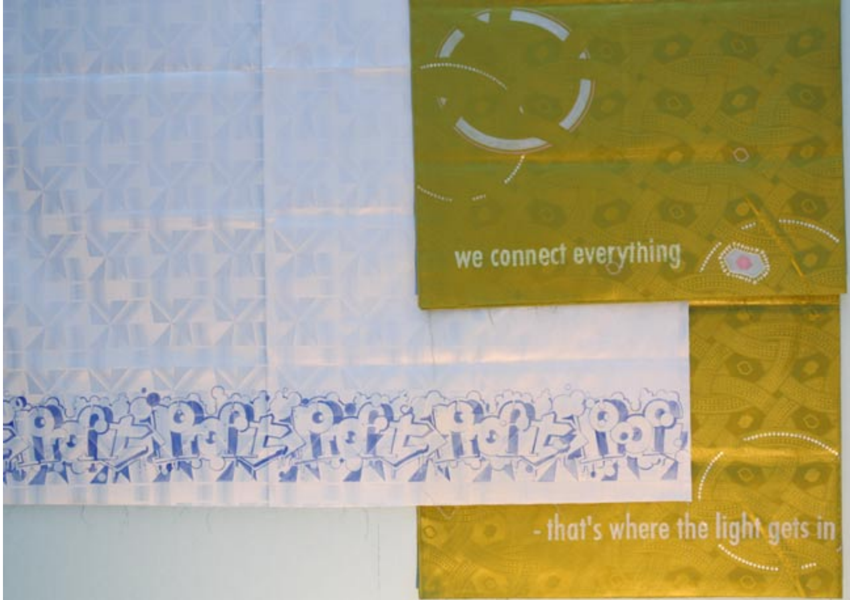
“profit”, 2009, ca. 180x1140cm, “we connect everything”, 2009 ca. 180x140cm