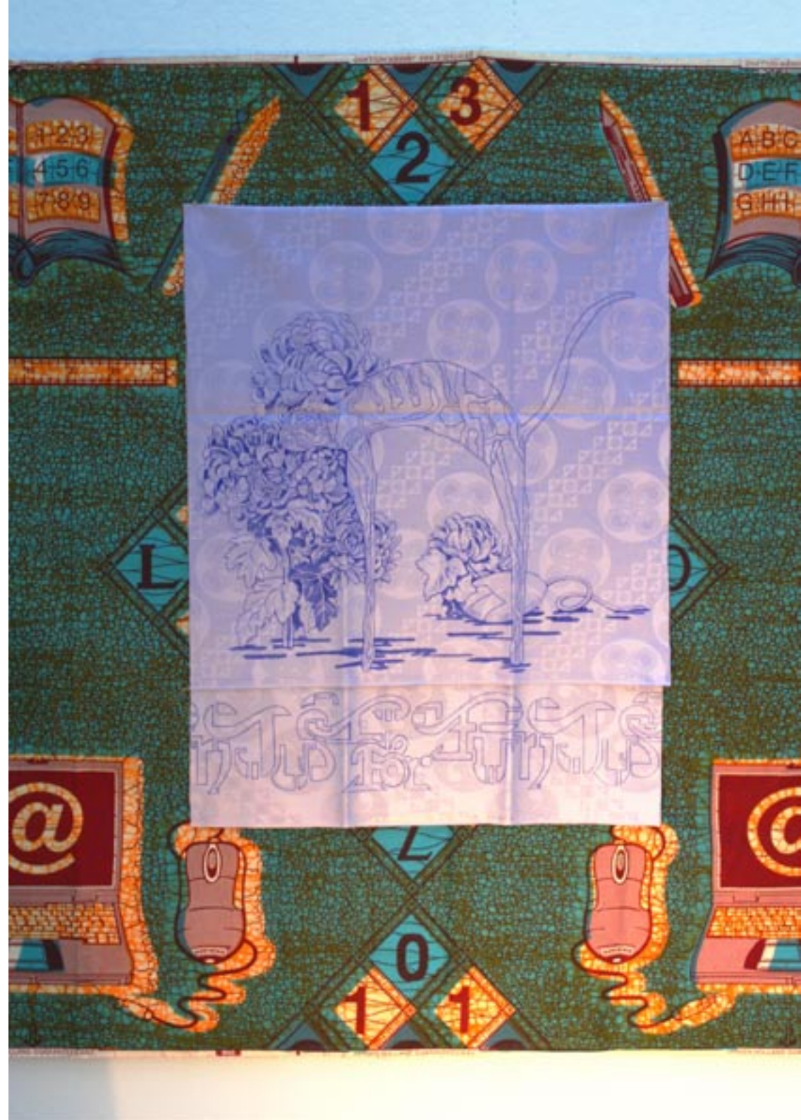
rechts: "Armstrongs", Acryl auf Damast, 2010, ca. 100x140cm links: "Just for Fun", Acryl auf Damast ca. 40x100cm