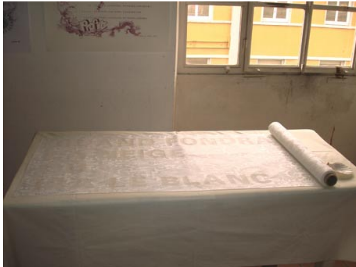
“quand fondra la neige ou ira le blanc”, nach Remy Zaugg nach Shakespeare Acryl auf Damastrolle, 2009