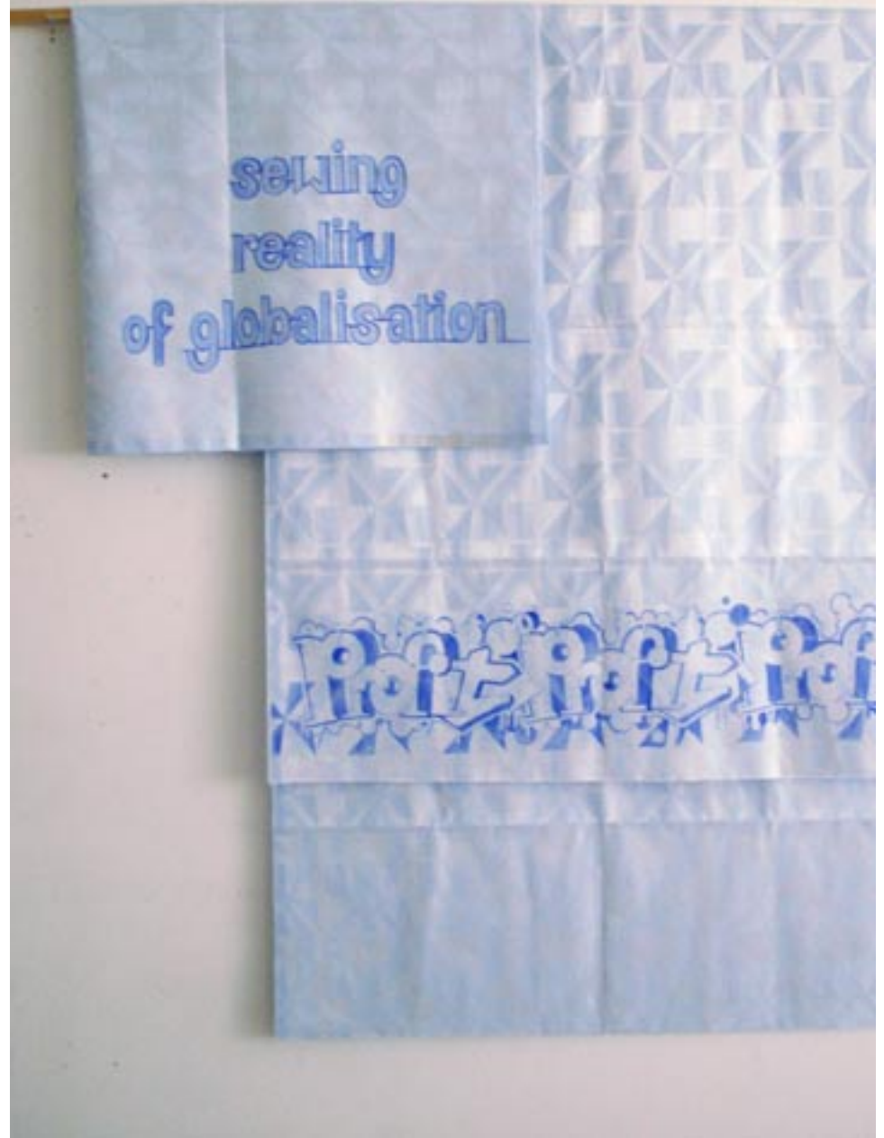
Acryl auf Afrikadamast, ca. 180x140cm & 90x140cm