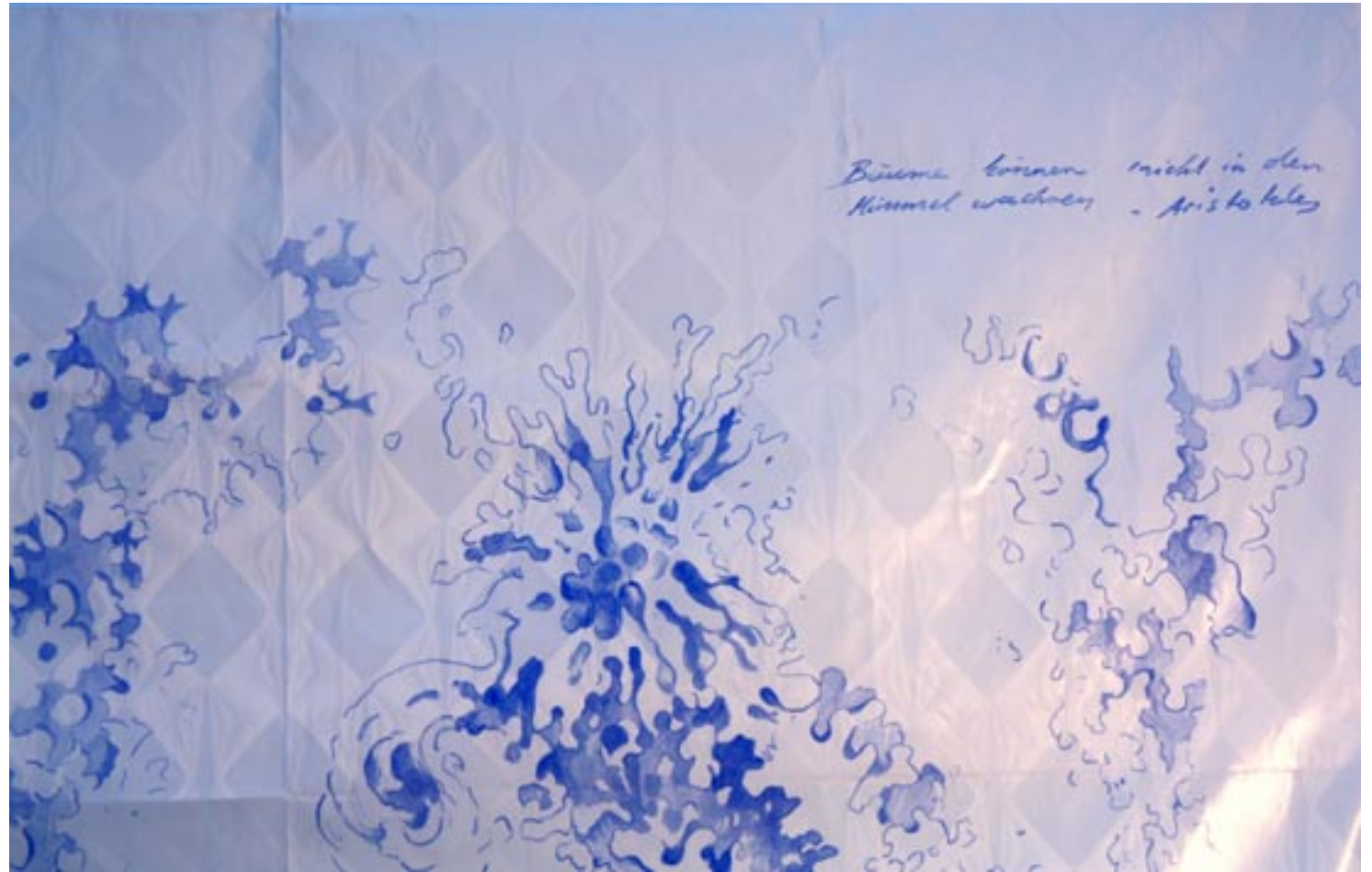
“Bäume können nicht in den Himmel wachsen”, Acryl auf Afrikadamast, 2010, ca. 140x200cm