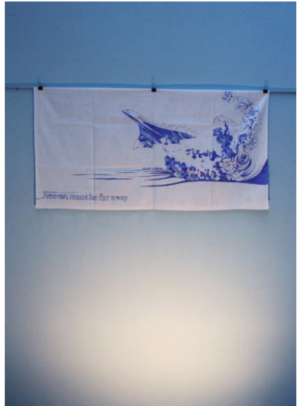
"concorde", Acryl auf Damast, 2010, ca 50x100cm

Copa & Sordes Sierenzerstrasse 83 CH-4055 Basel T/F: ++41 61 301 56 22 copaetsordes@swissonline.ch www.xcult.org/copaetsordes