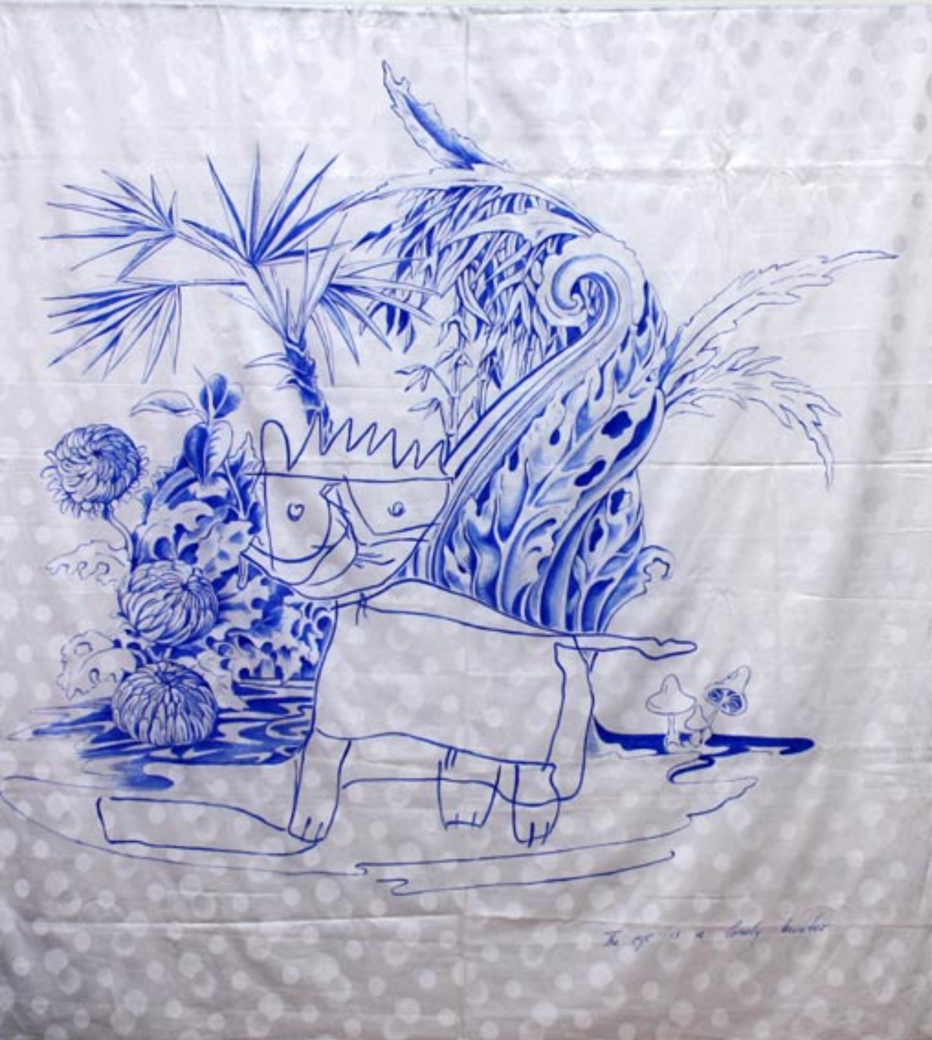
"the eye is a lonely hunter" Acryl auf Damast, 2010, ca. 160x160cm