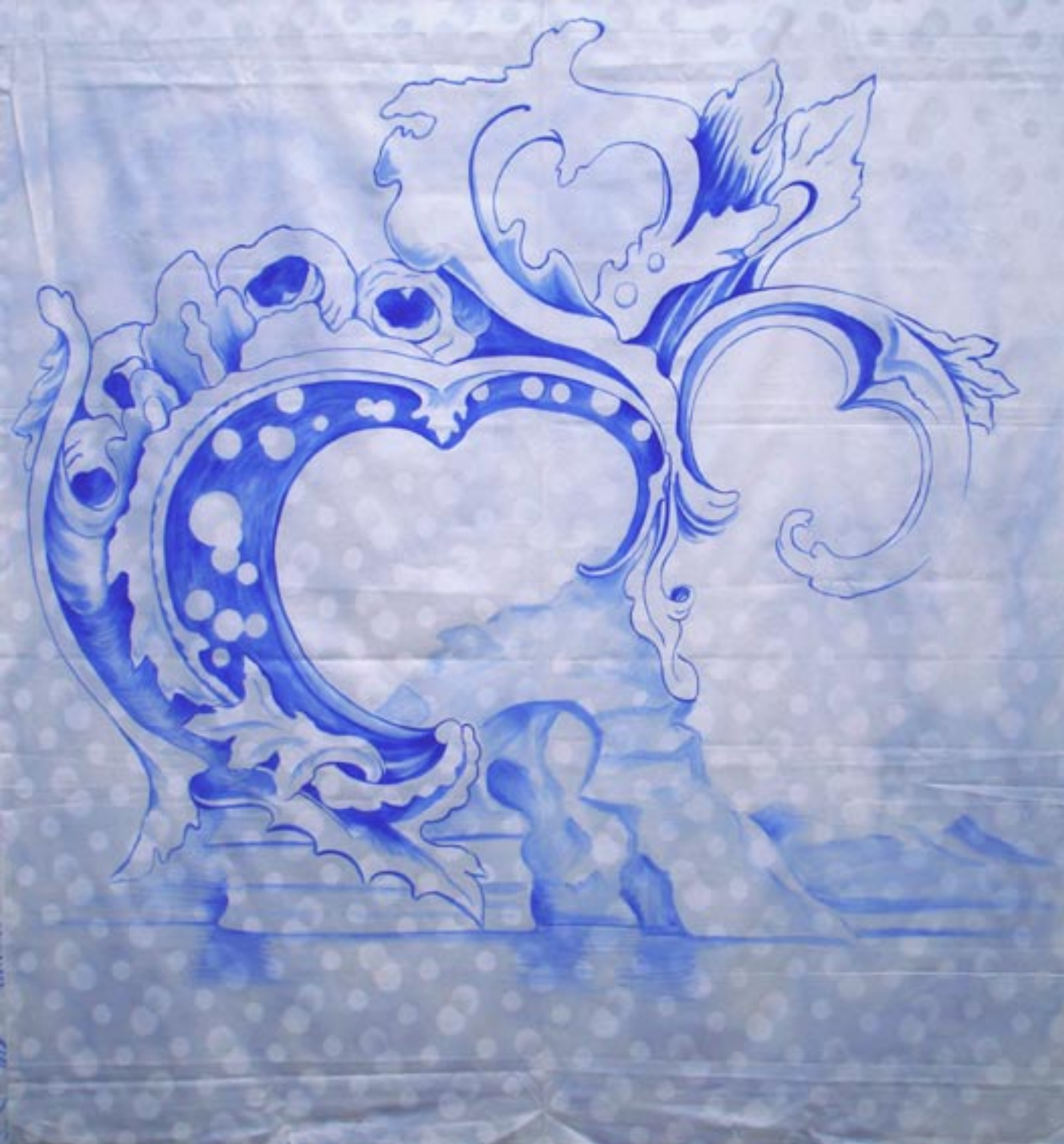
“Eisberg, Acryl auf Damast, 2010, ca. 160x160cm