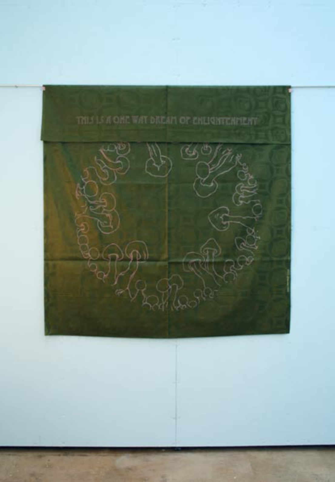
"this is a one way dream of enlightenment", 2010, ca. 160x140cm