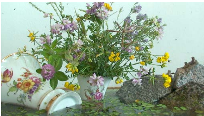
Frogs_120603_2 Videotableau HDV, 31 min, 2011