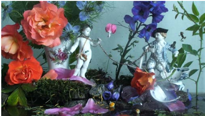
Frogs_120603_2 Videotableau HDV, 31 min, 2012