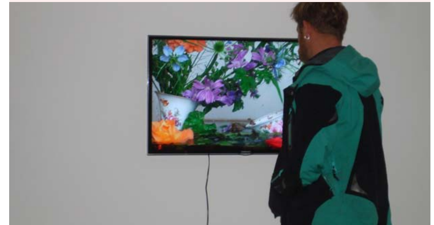
Frogs110605_2 Ausstellungsansicht iaab Projektraum Basel , 2011

Die Videotableaux beziehen sich in ihrer Bildkomposition auf Genre- und Stilllebenmalerei des 17. und 18. Jahrhunderts.