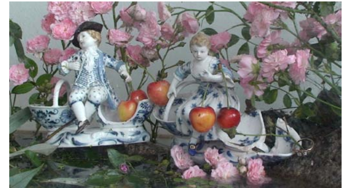
Frogs_110616_2 Videotableau HDV, 60 min, 2011