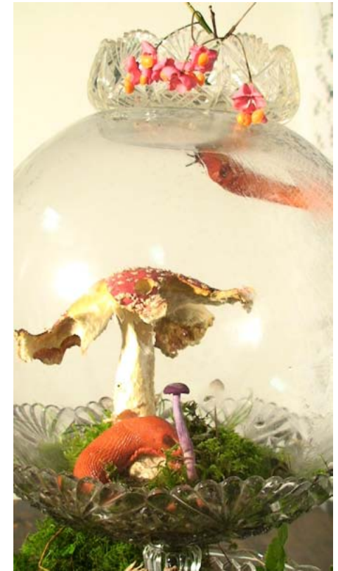
Slugs101004_1, Videotableau HDV, 30 min, 2010

Alltag im Wespennest. In starker Vergrößerung nimmt das Leben dort menschliche Dimensionen an. Larven werden gefüttert und sperren ihre Mäuler auf wie junge Vögel, Arbeiterinnen fächeln ihnen mit ihren Flügeln frische Luft zu und das Sonnenlicht wirft ein filigranes Schattenspiel an die Wand.