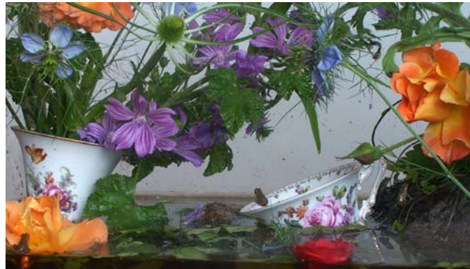
Frogs_110605_2 Videotableau HDV, 31 min, 2011