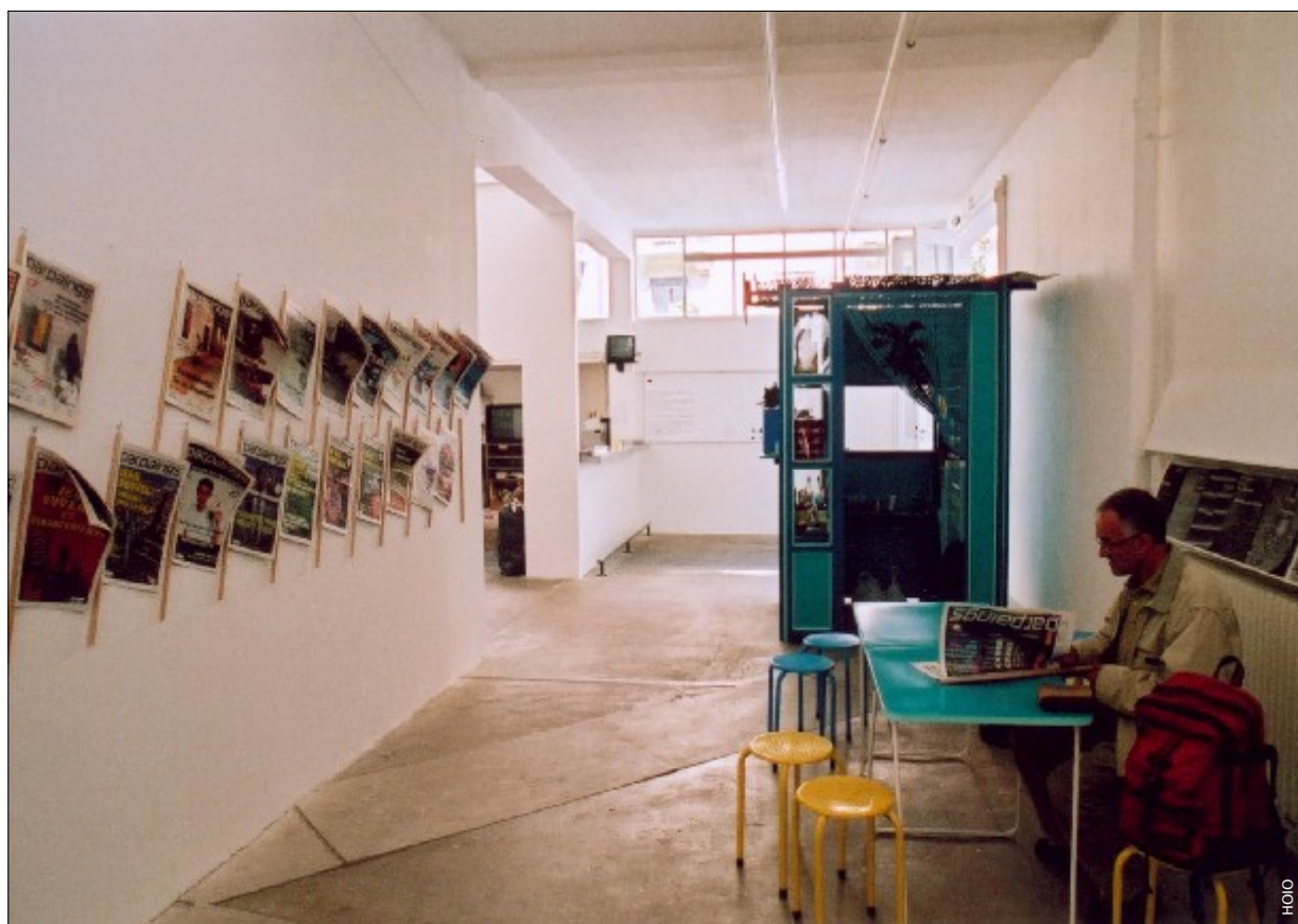
Die BOUTIK im Genfer Kunstraum attitudes, von der Südseite her gesehen.

Die Auswirkung dieser tropischen Stürme ist ausserordentlich grausam: Heftige Winde reissen alles mit, was ihnen auf ihrem Weg begegnet. Sintflutartige Regengüsse überschwemmen Felder, Strassen und Häuser. An den unberechenbarsten Stellen brechen Sturzbäche hervor und Erdbeben