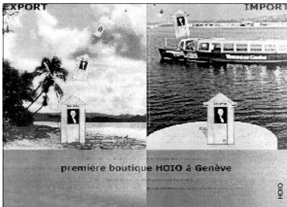
Die Ankündigung der BOUTIK von HOIO im sechsten Heft von attitudes (links) und die Dokumentation in «le journal» no 7

Die Demontage des kleinen Bauwerks dauert allerhöchstens ein bis zwei Stunden – das ist schnell genug, denn die Pré-alerte (die zweite Vorwarnung nach der Stufe der Vigilance) wird auf der Insel meist vier bis sechs Stunden vor dem